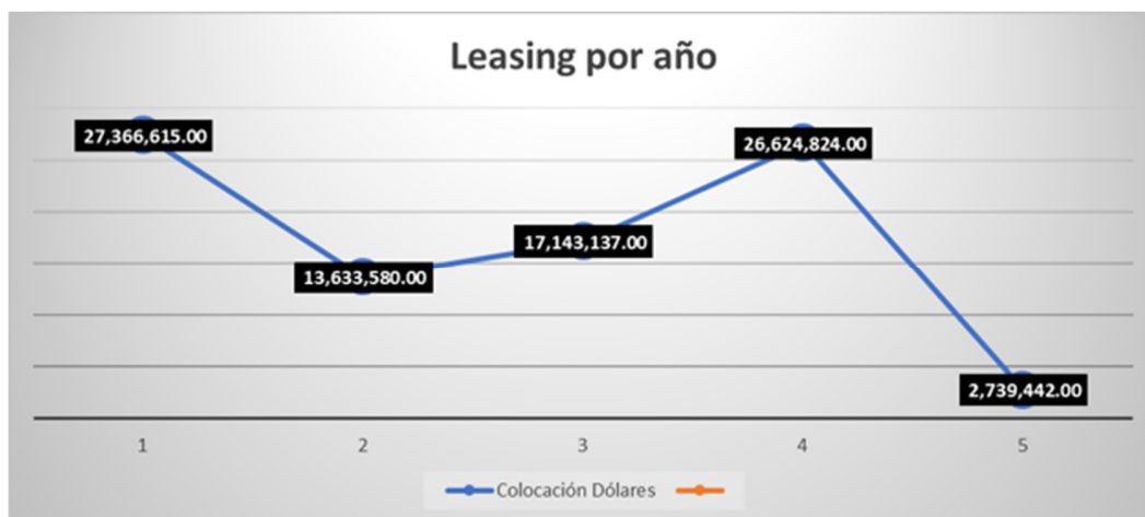
Cuadro No. 1 Crecimiento Productos Leasing Enero 2022-2023